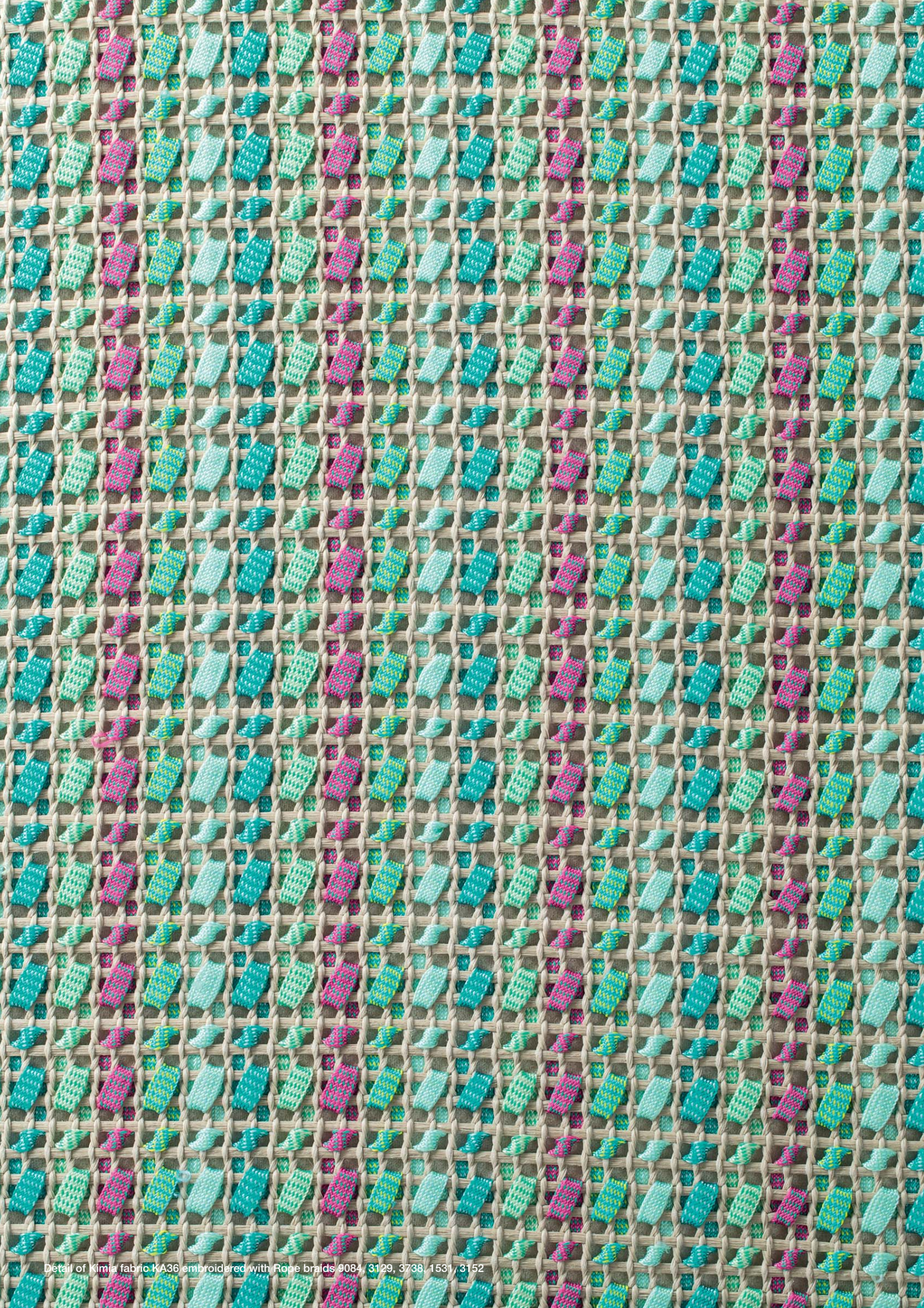
Detail of Kimia fabric KA36 embroidered with Rope braids 9084, 3129, 3738, 1531, 3152