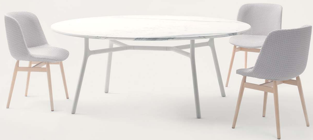
B124A in marble PT512