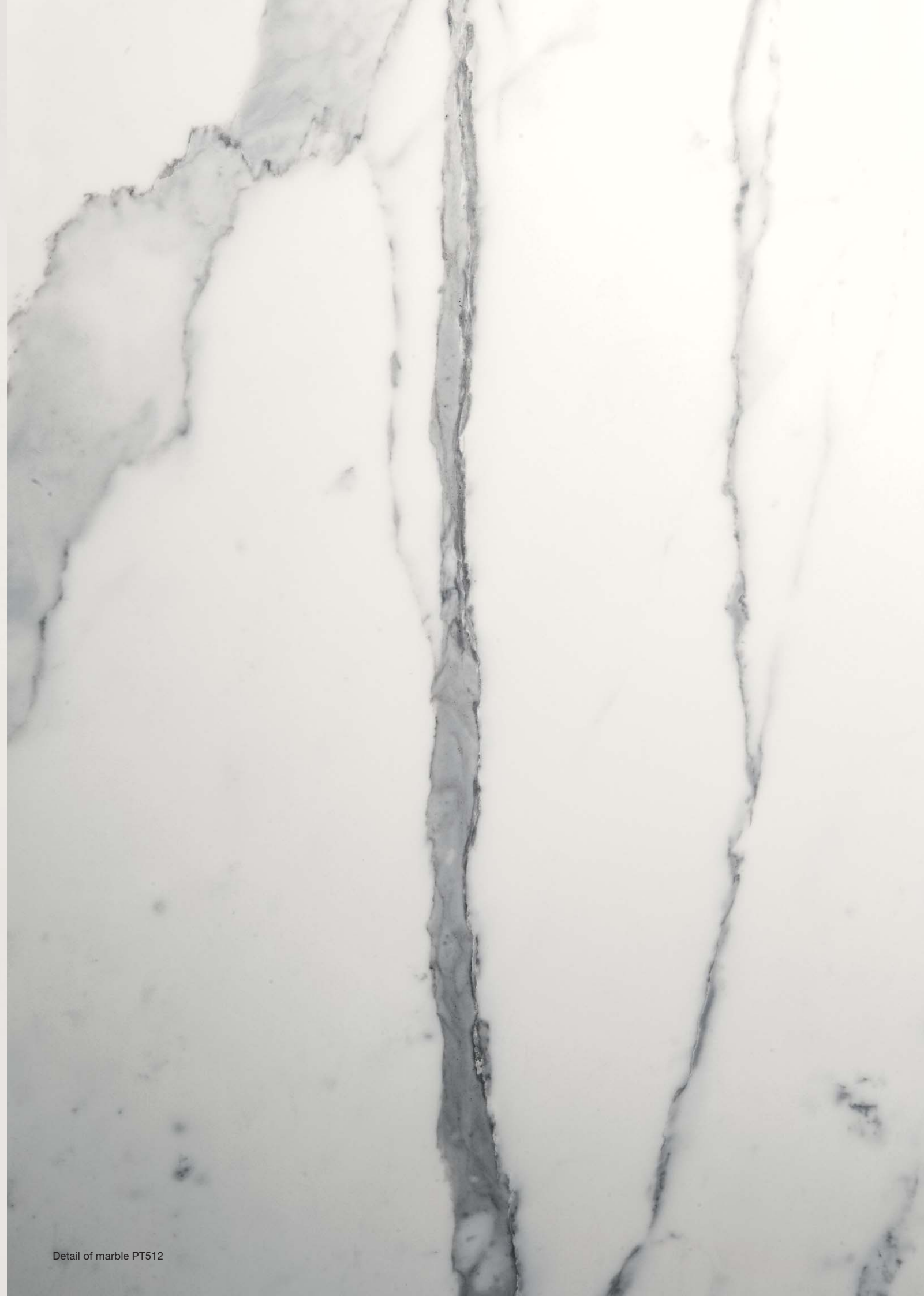
Detail of marble PT512